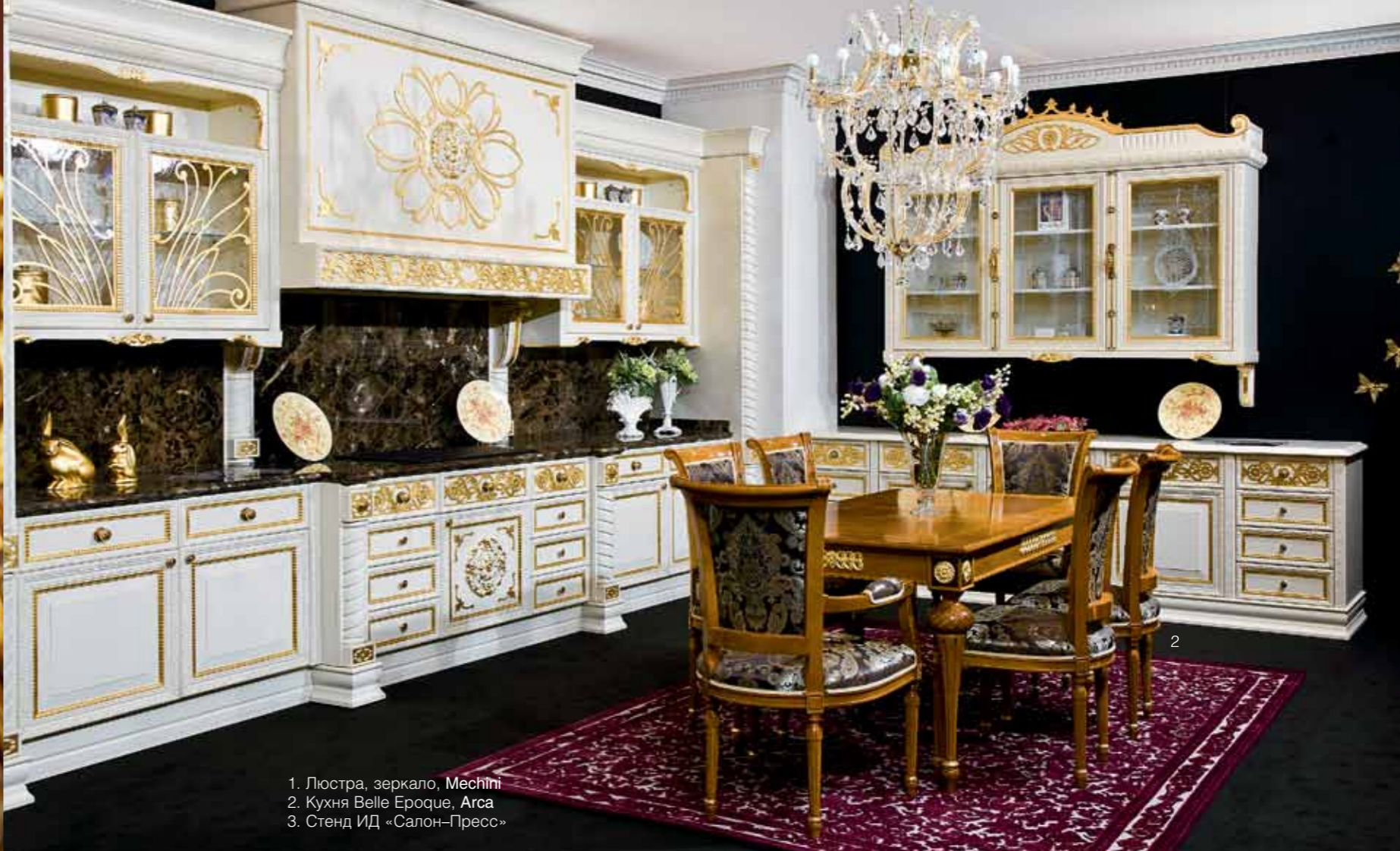
1. Люстра, зеркало, Mechini 2. Кухня Belle Epoque, Arca 3. Стенд ИД «Салон-Пресс»

На 3-м Московском международном салоне «Интерьер Шоу» выставлялись лучшие из лучших — производители мебели и аксессуаров, благодаря которым наши дома становятся уютнее и краше. В этом году экспоненты подобрались самые звёздные