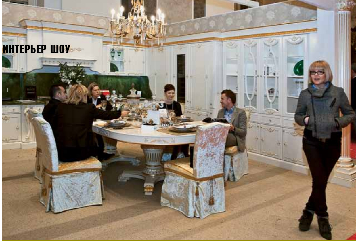
1. Стенд Palladio Interiors. Кухня, Moletta&Co., фарфор, Rudolf Kämpf. 2. Фрагмент стенда Azart Gallery. 3. Флористические композиции студии цветов «Золотой Лотос». 4. Плитка, Konzept. 5. Кровать, Croce